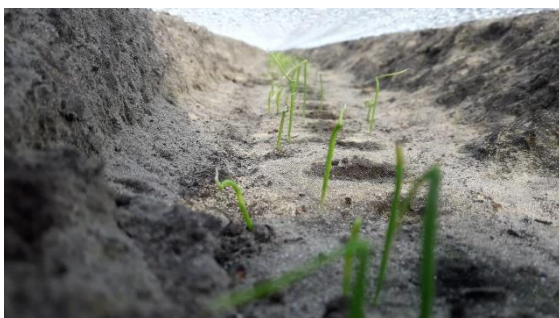
Figuur 2: Uien gezaaid onder folie, 24-02-2019 gezaaid in Erp bij een van onze telers

De voorjaarswerkzaamheden zijn in verschillende regio's al vroeg begonnen. Tijdens de mooie voorjaarsdagen eind februari zijn op verschillende plekken bieten en uien gezaaid, maar ook de echte vroege aardappelen zijn gepoot! Deze zaaiuien hebben nu een voorsprong op de uien die later zijn gezaaid. Daarnaast is er een klein deel onder folie gezaaid (zie foto).